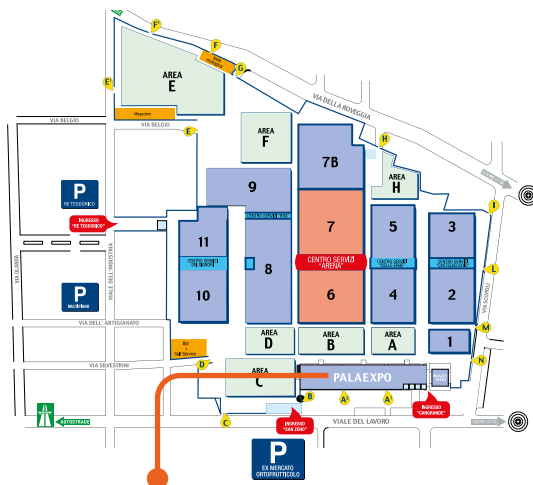
Centro Congressi PALAEXPO - Entrata A2